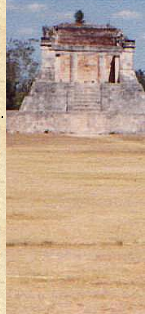
Chichén Itzá: Campo de Bola