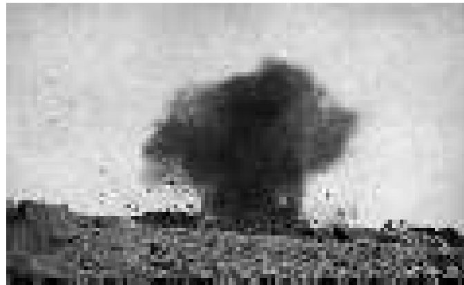
Selongson/granat Artileri Jerman diledakkan didekat garis Inggris.