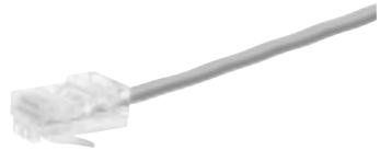
带 RJ-45 连接器的 5 类电缆

5 类电缆与电话电缆相似，但是它更厚，并且使用的连接器也更宽。请勿使用电话电缆或同轴电缆。